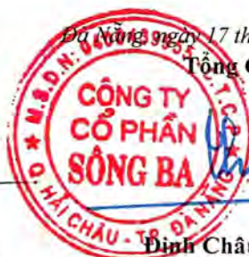
Đinh Châu Hiếu Thiện