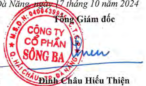
Đinh Châu Hiếu Thiện