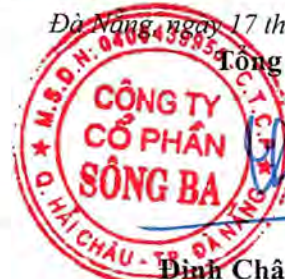
Đinh Châu Hiếu Thiện